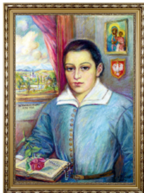
Powyżej obraz przedstawiający św. Stanisława Kostkę wykonany przez Wandę Zagórką w 1995 r. Ze zbiorów Muzeum Historycznego w Przasnyszu.